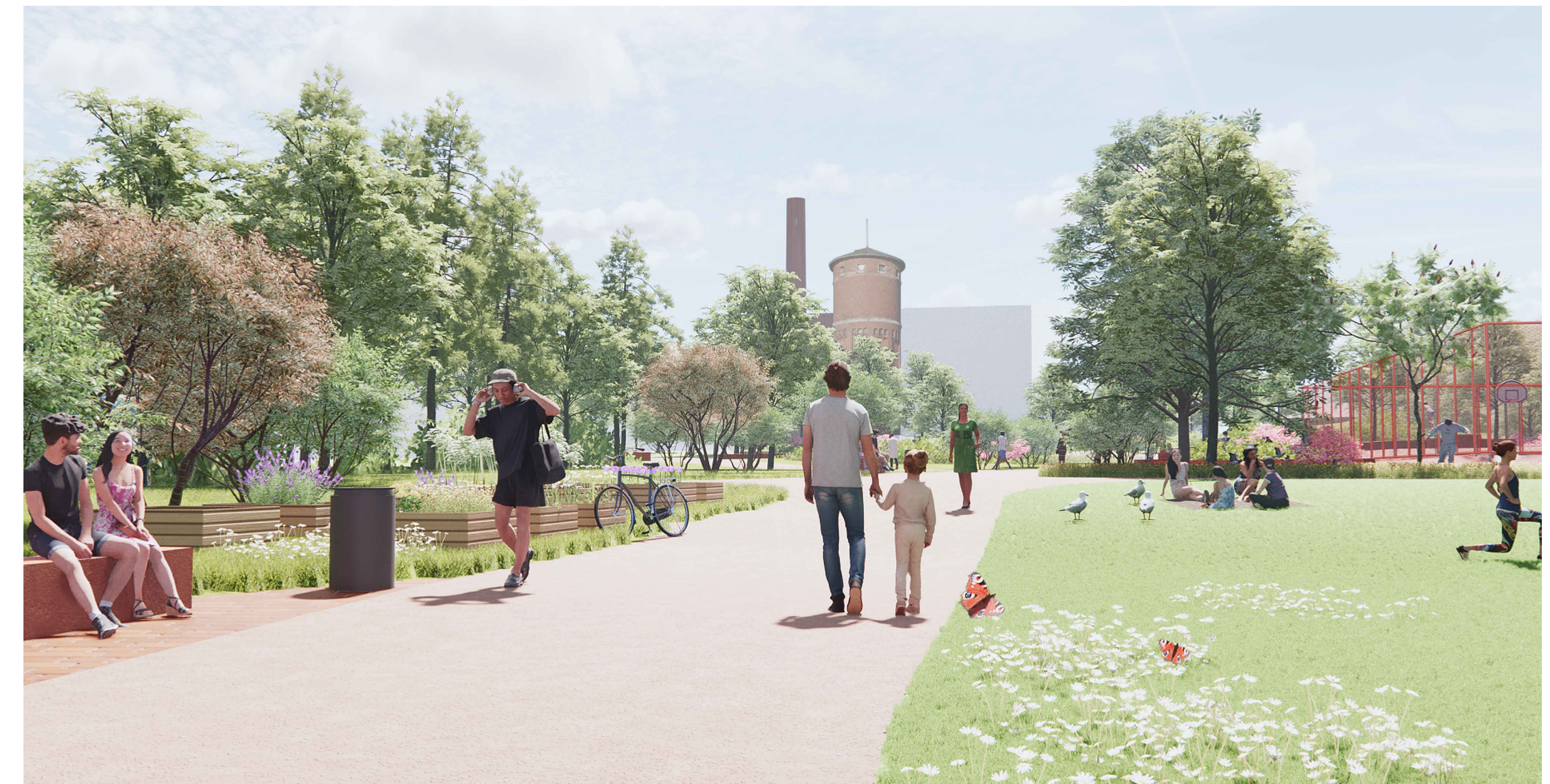
Näkymä Sellupuiston suunnasta puistoon.